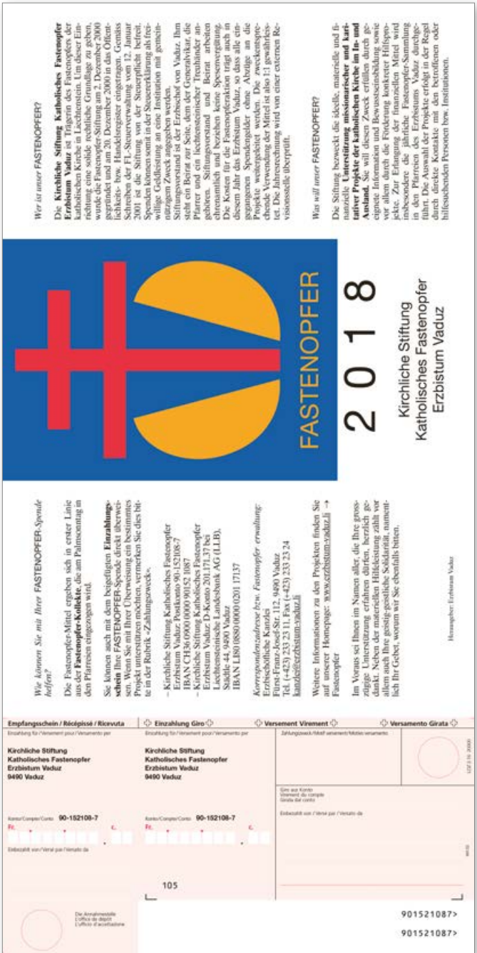
Einzahlungsschein mit Flyer gefaltet 108x210 mm (Wickelfalz) Perforation (längs und quer) Offsetdruck 5/4-farbig, CMYK & Pantone / CMYK