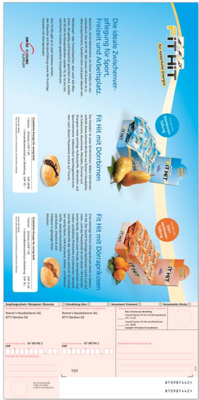
Einzahlungsschein mit Flyer gefaltet 106x210 mm (Parallelfalz) Perforation (längs und quer) Offsetdruck 4/1-farbig, CMYK / schwarz